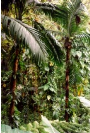
Palmenjungle op de hellingen van Mount Scenery op Saba.

De terreinbeherende instanties dienen een zo groot mogelijke mate van financiële onafhankelijkheid te verwerven; zowel de overheid als de grote internationale NGO's zijn als donor een onzekere factor, vooral waar het gaat om het duurzaam dekken van de operationele kosten. Een voldoende financiële buffer is van belang om in een situatie met teruglopende inkomsten (wegvallen toerisme door orkanen e.d., wegvallen subsidies overheid, plotseling beëindigen van een donor relatie) het hoofd boven water te kunnen houden.