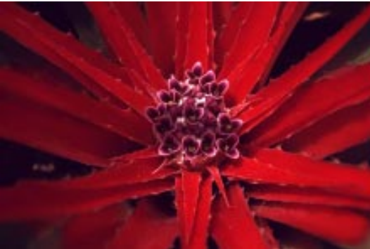
Bloeiende Bromelia in het Christoffelpark, Curaçao.

Dit document brengt uitsluitend de financieringsbehoeften en -mogelijkheden betreffende het beheer door de bestaande beheersorganisaties van twee natuurgebieden per eiland in kaart.