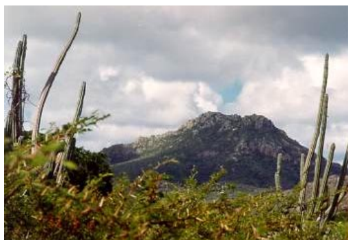
De St. Christoffelberg in het gelijknamige natuurpark op Curaçao.

De financiële situatie van de natuurbeheersorganisaties is in beeld gebracht door KPMG (1999). Onderstaand schema geeft een financieel overzicht van de stand van zaken voor de periode 1996-1998, omgerekend naar jaarbedragen.