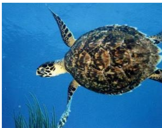
Een jong exemplaar van de internationaal bedreigde karetschildpad op het koraalrif bij St. Maarten.

Er dient onderscheid gemaakt te worden tussen korte en lange termijn financiering. De activiteiten dienen dan ook in drie fasen plaats te vinden.