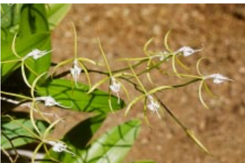
De orchidee Epidendrum ciliare hier op St. Maarten, komt uitsluitend voor op de kleine oostelijke eilanden in het Caribisch gebied.

De bestaande situatie met betrekking tot natuurbeheer is als volgt: