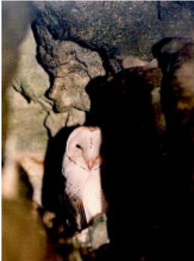
De Curaçaose kerkuil, een endemische ondersoort.

In het voorgaande is de aankoop van terreinen buiten beschouwing gebleven. Overweging daarbij is dat op dit moment de financiële verzelfstandiging van het beheer van de bestaande parken prioriteit heeft. Indien aankoop van terreinen aan de orde is, zal dit afzonderlijk aangekaart moeten worden bij de diverse donoren. Verder dient de hierin beschreven opzet tot het invoeren van een minimaal noodzakelijke basisstructuur waarbij onderscheid gemaakt dient te worden tussen het uiteindelijke wensenpakket en de hieruit voortvloeiende organisatorische structuren. Met de implementatie van dit plan zullen de verschillende parkbeheerders zelf kunnen werken aan de verwezenlijking van het uiteindelijk gewenste situatie. De snelle invoering van het hier voorgestelde plan is de eerste prioriteit.