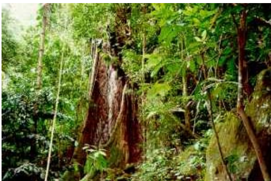
Tropisch regenwoud in de krater van "the Quill" in het Nationaal Park op St. Eustatius.