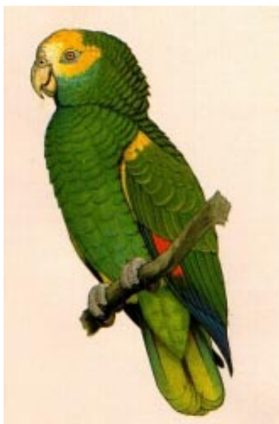
De Bonaireaanse Amazonepapagaai of Lora, een bedreigde, endemische ondersoort, die slechts op Bonaire en enkele Venezolaanse eilanden voorkomt.