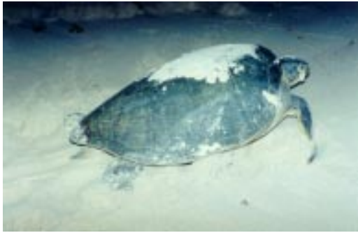
Soepschildpad (Chelonia mydas) op een strand op Bonaire om haar eieren te leggen.

De natuurbeheersorganisaties van de Nederlandse Antillen hebben het financieel moeilijk. De organisaties op Sint Eustatius en Sint Maarten, de jongste beheersorganisaties, worden zelfs direct in hun voortbestaan bedreigd. Op het Natuurforum 2000 (Curaçao, 28-30 Augustus 2000) is door alle aanwezige partijen het ontbreken van een basis financieringsstructuur unaniem als voornaamste reden gezien voor de huidige crisis zoals ook te lezen valt in de slotverklaring: