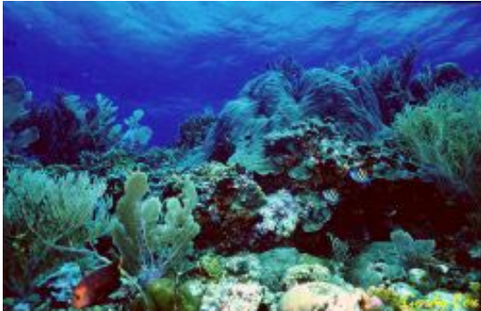
Het buitengewoon weelderige koraalrif bij Bonaire en Curaçao.

Natuurbescherming op de Antillen is noodzakelijk en onontbeerlijk. De eilanden bezitten een grote natuurlijke rijkdom boven en onder water. Er komen tal van endemische soorten en ecosystemen voor die uniek zijn voor het koninkrijk, zoals de koraalriffen, het enige stuk regenwoud van het Koninkrijk in nationaal park de Quill, de unieke nevelbossen van Mount Scenery op Saba, de flamingo-broedgebieden op Bonaire en de broedstranden voor zeeschildpadden op alle eilanden (WNF publicatie "Islands"; KNAP publicatie "Biologische inventarisatie Bovenwinden").